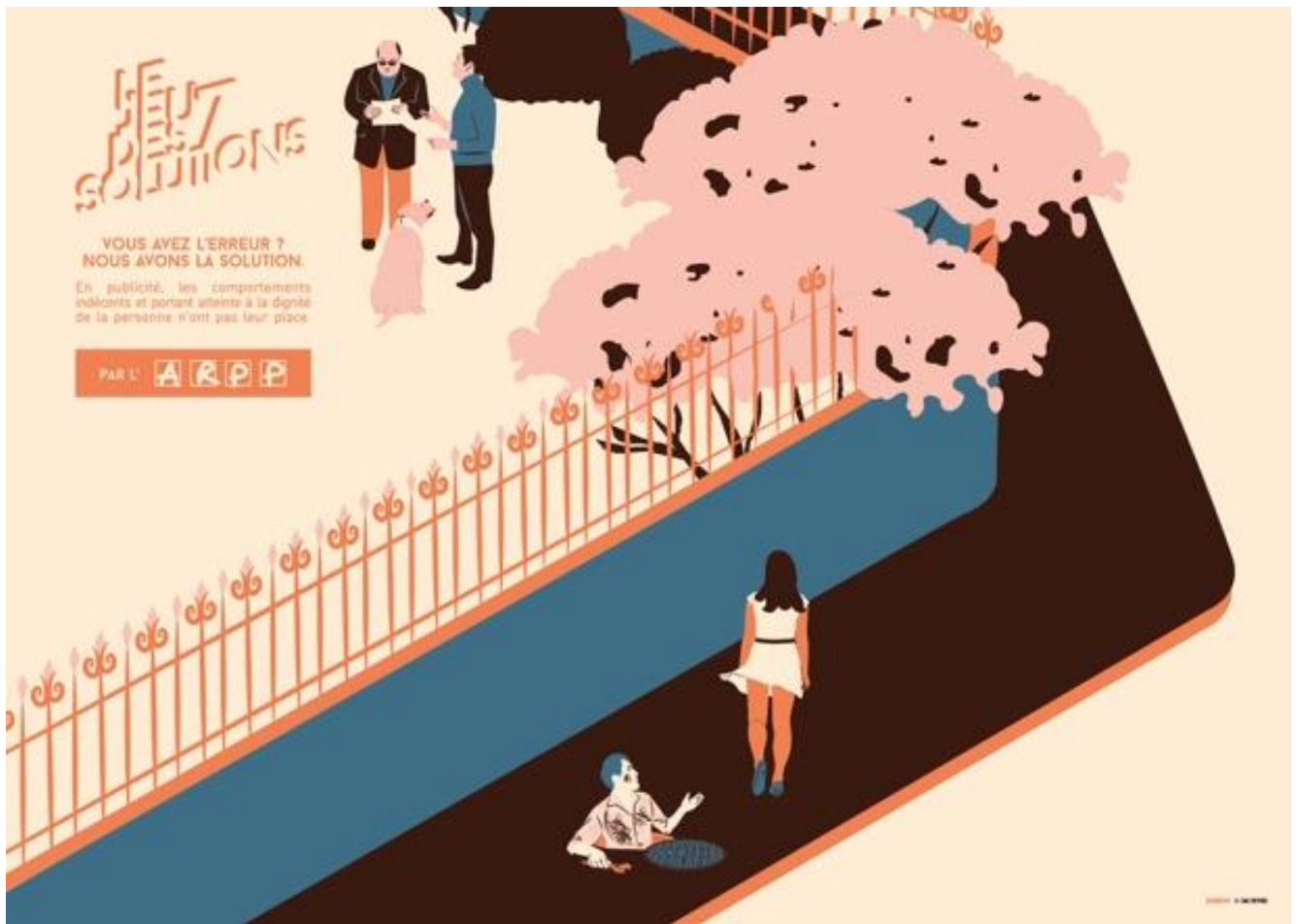
Illustration : F. DEBIEVE