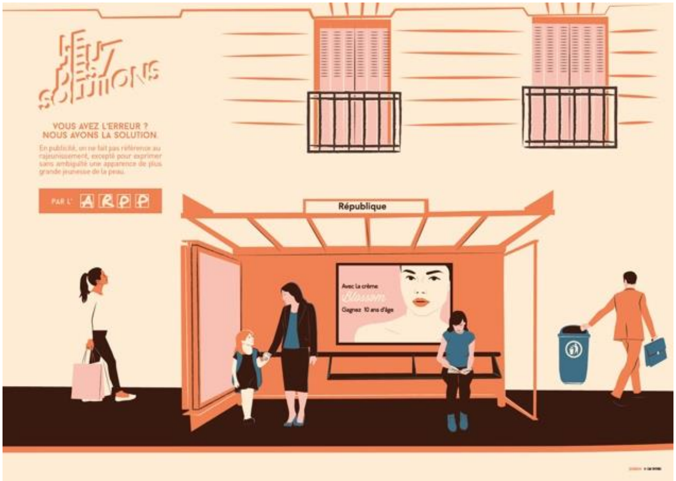
Illustration : F. DEBIEVE